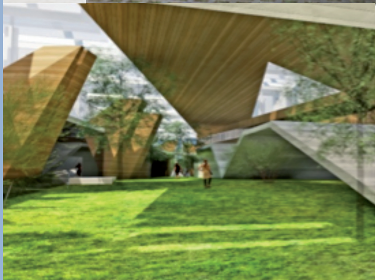
Πολυτεχνική σχολή, τμήματα μηχανικών