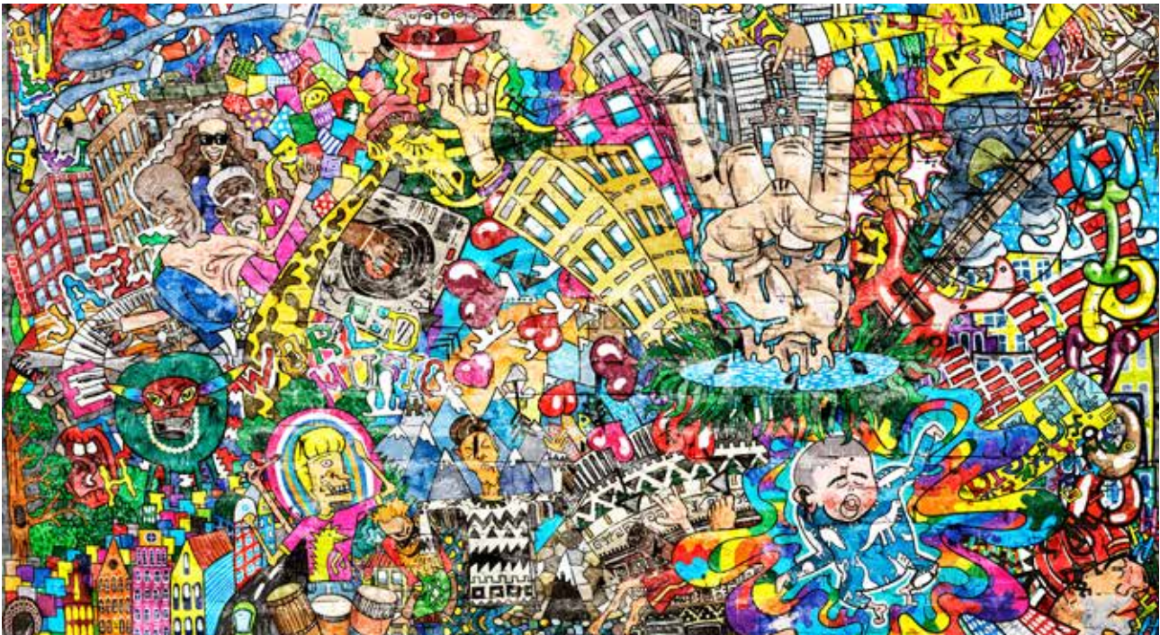
Kultuuri- ja loomesektori kujutis (Euroopa Komisjon)

Kõige suurema muutuse tõi aga kõige esimene sünteetiline väärtpaberistamistehing Baltimaades, mis tehti kohaliku vahendajapanga Luminoriga. Tänu nii tagatis- kui ka vastutagatistehingutele EIF-i ja EIP vahel saab Luminor praegustes keerulistes majandusoludes anda täiendavalt laenu väikestele ja keskmise suurusega ettevõtetele ning keskmise kapitalisatsiooniga ettevõtetele. Tagatisega saab toetada vähemalt 660 miljoni euro ulatuses lisalaene ja -liisinguid nendele ettevõtjatele kõigis kolmes Balti riigis.