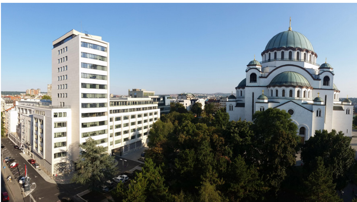
Zgrada pravosudnih organa u Katanićevoj ulici.