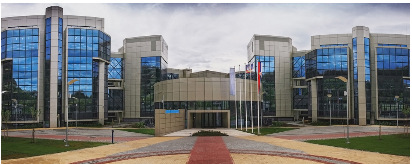
Naučnotehnološki park Zvezdara.

poboljšanje naučne infrastrukture u oblasti medicinskih nauka. Investicioni potprojekti obuhvataju, između ostalog, sledeće: Naučni centar u Petnici, Institut Biosense, proširenje objekata Elektronskog fakulteta u Nišu, nabavku nove opreme za istraživanja i osnivanje naučnih i tehnoloških parkova u Beogradu, Nišu, Novom Sadu i Kragujevcu.