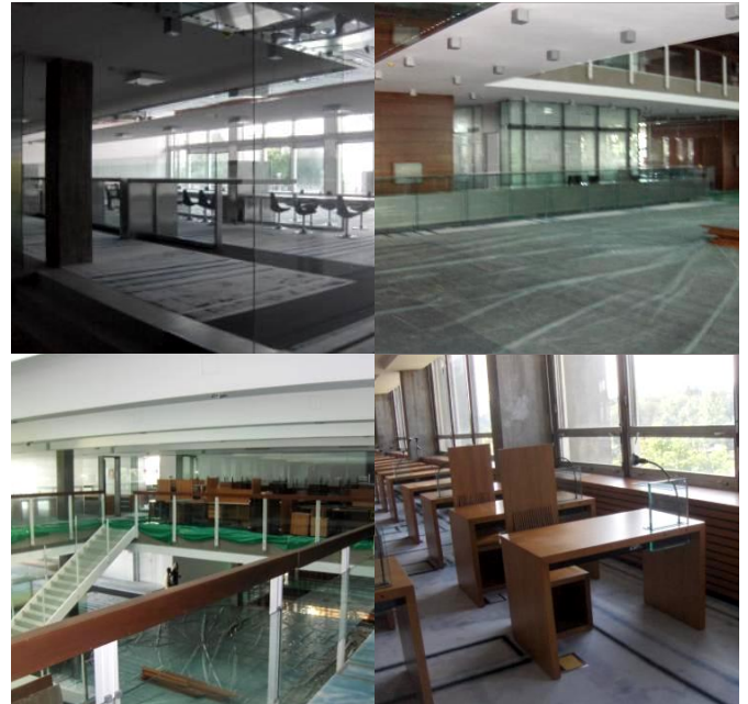
Narodna Biblioteka Srbije: pre i posle.