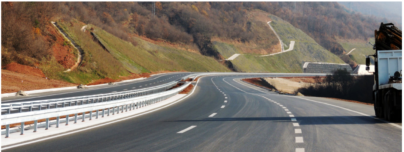
Projekat drumskog koridora X (deonica između Pirota i Dimitrovgada).

Bugarske (deonica E-80) i Srbije i Bivše Jugoslovenske Republike Makedonije (deonica E-75). Očekivani ekonomski benefiti najvećim delom proističu iz uštede u vremenu putovanja i smanjenog broja saobraćajnih nezgoda, pored uštede na troškovima putovanja i održavanja vozila. Radovi su u toku i njihov završetak se očekuje krajem 2018. godine.