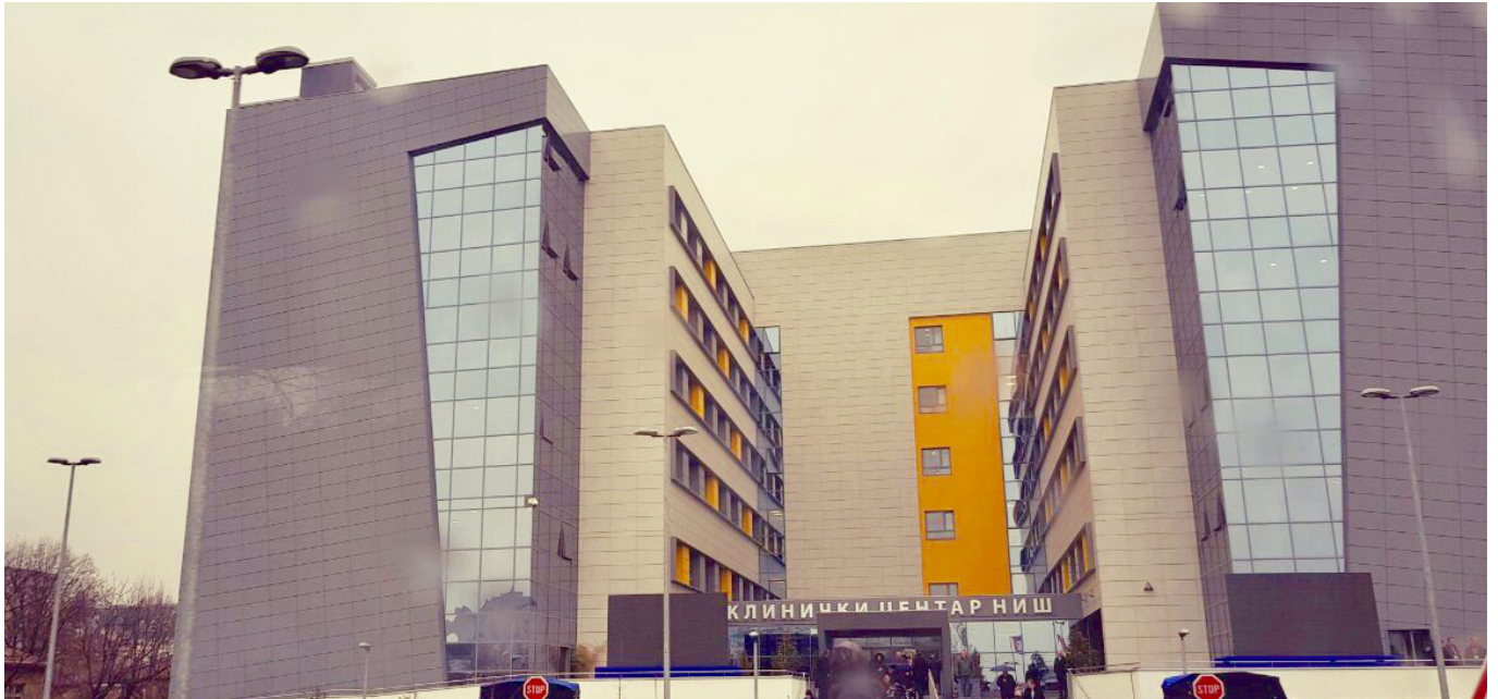
Klinički centar u Nišu.

To predstavlja važan kamen-međaš na putu razvoja sistema zdravstvene zaštite u Srbiji jer će se zahvaljujući tom kliničkom centru poboljšati mogućnost pristupa visokokvalitetnoj zdravstvenoj zaštiti građana Srbije; taj centar će opsluživati oko 2,5 miliona građana Srbije. Nova bolnica ima površinu od oko 45.000 kvadratnih metara i u njoj se nalazi više od 600 postelja.