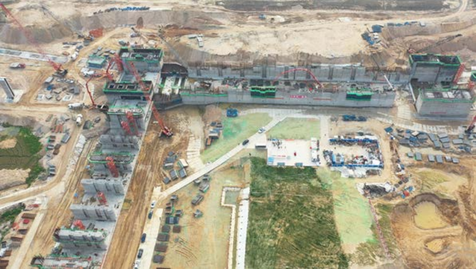
江西信江八字嘴航电枢纽工程一期施工现场