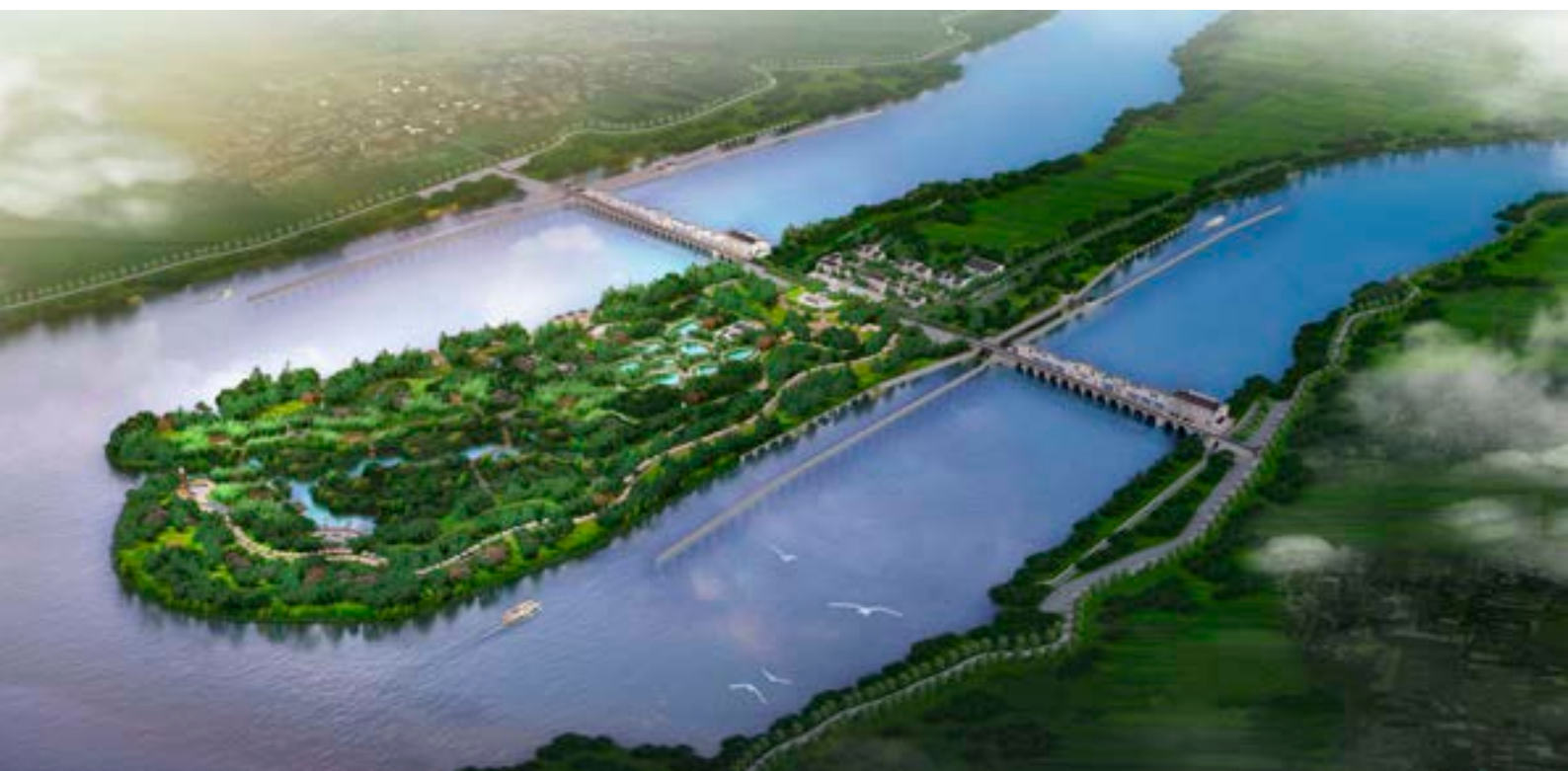
江西信江八字嘴航电枢纽工程

该水运项目总投资为6亿欧元，将在信江（江西五大河流之一）下游建设八字嘴航电枢纽。该枢纽将于2022年底投入使用，联合其他航运枢纽和梯级船闸，将显著提升信江的航运能力。