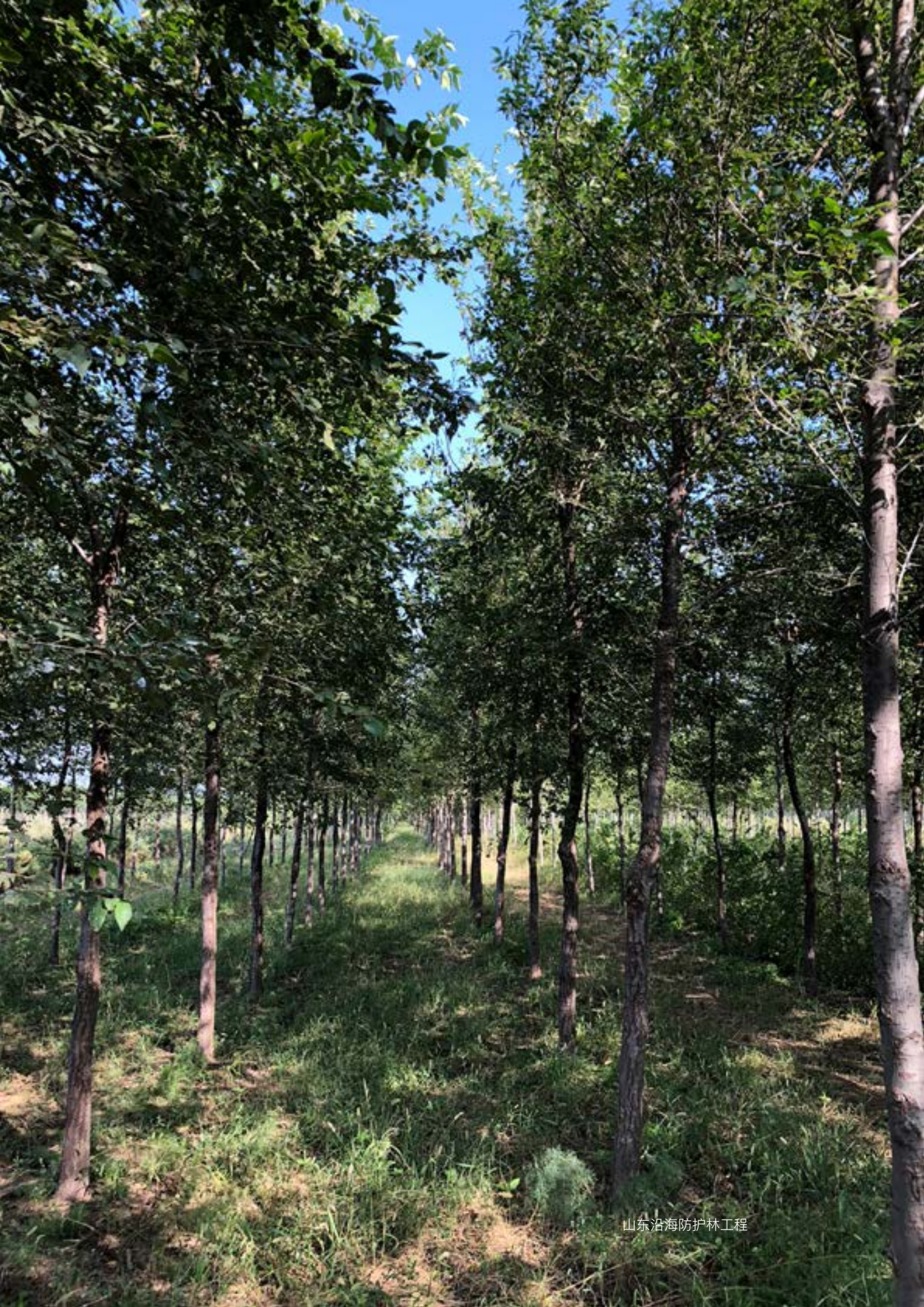
山东沿海防护林工程