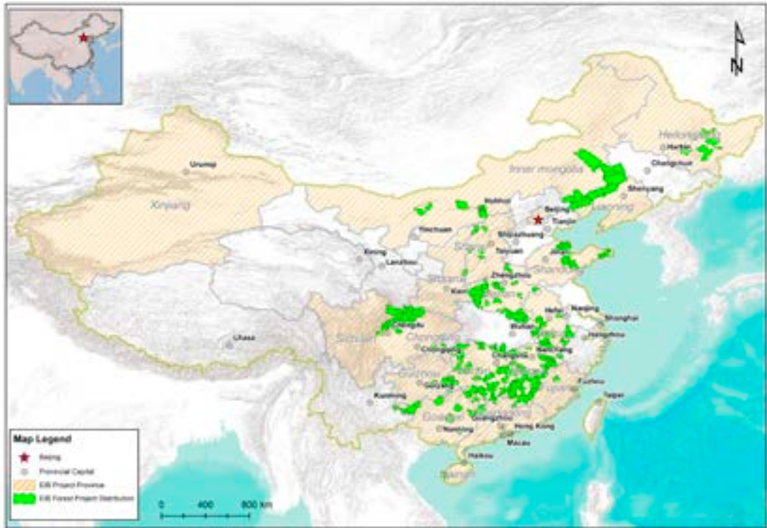
欧投行项目所在省份以及林业项目分布