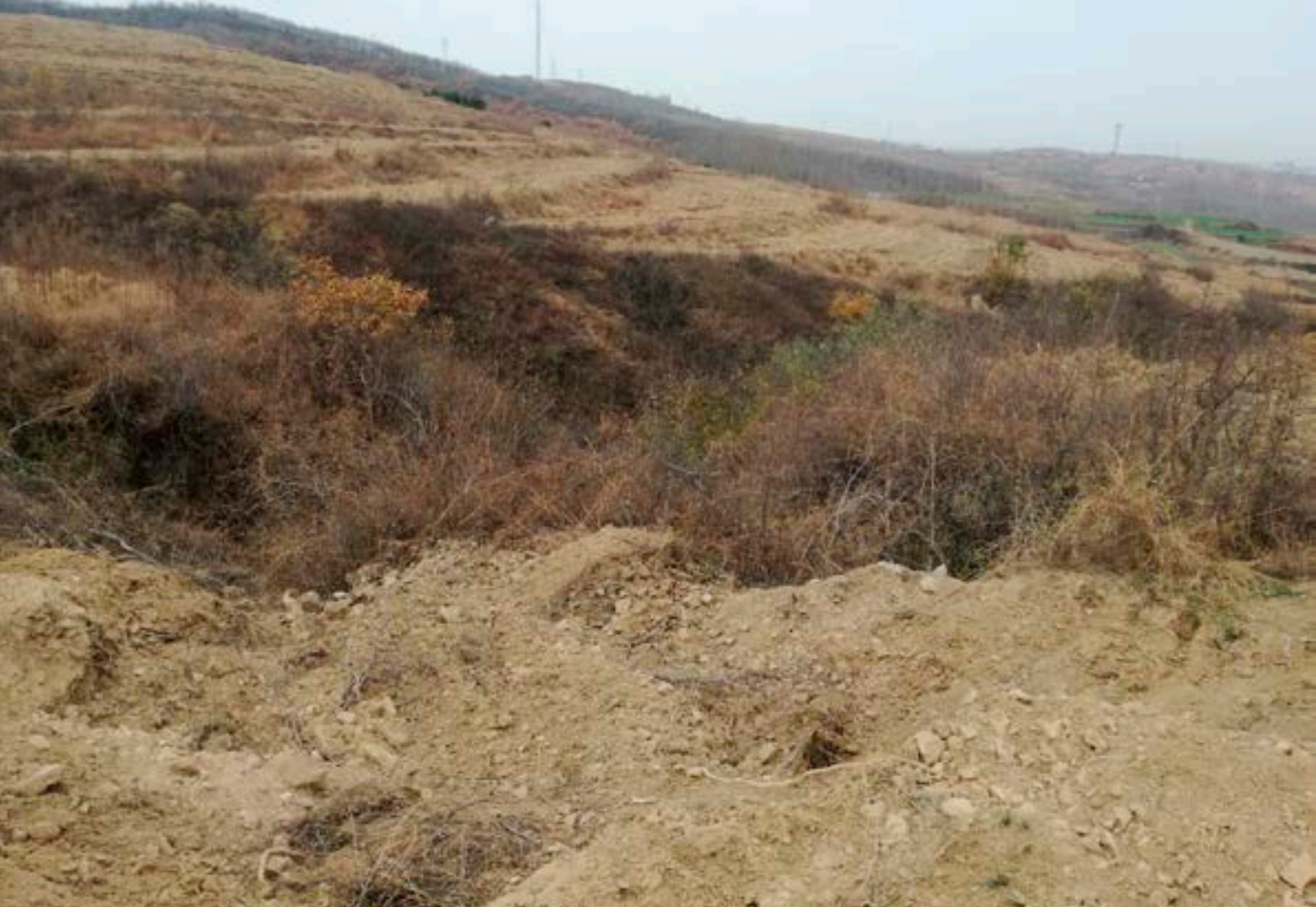
山东省潍坊诸城造林前后对比