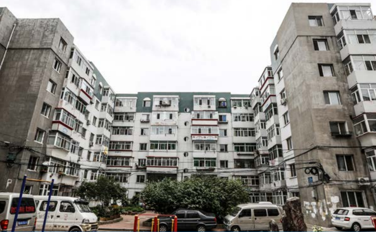
哈尔滨民安小区37号楼节能改造前后对比