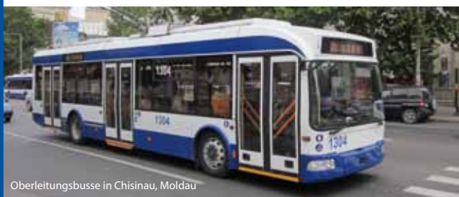
Oberleitungsbusse in Chisinau, Moldau

Die moldauische Hauptstadt Chisinau wird von der EIB mit einem Darlehen von 10,3 Millionen Euro bei der Modernisierung der städtischen Infrastruktur unterstützt. Sechs Hauptstraßen werden saniert und erhalten eine neue Straßenbeleuchtung, Ampeln, Parkplätze und Entwässerungsanlagen. Das Projekt wird von der EBWE kofinanziert. Außerdem werden Mittel für technische Hilfe bereitgestellt. Im Rahmen der EU-Strategie für den Donauraum knüpft das Projekt an den erfolgreichen Abschluss des Programms zur Modernisierung der Oberleitungsbusse der Stadt an, das ebenfalls von der EIB und der EBWE mitfinanziert wird.