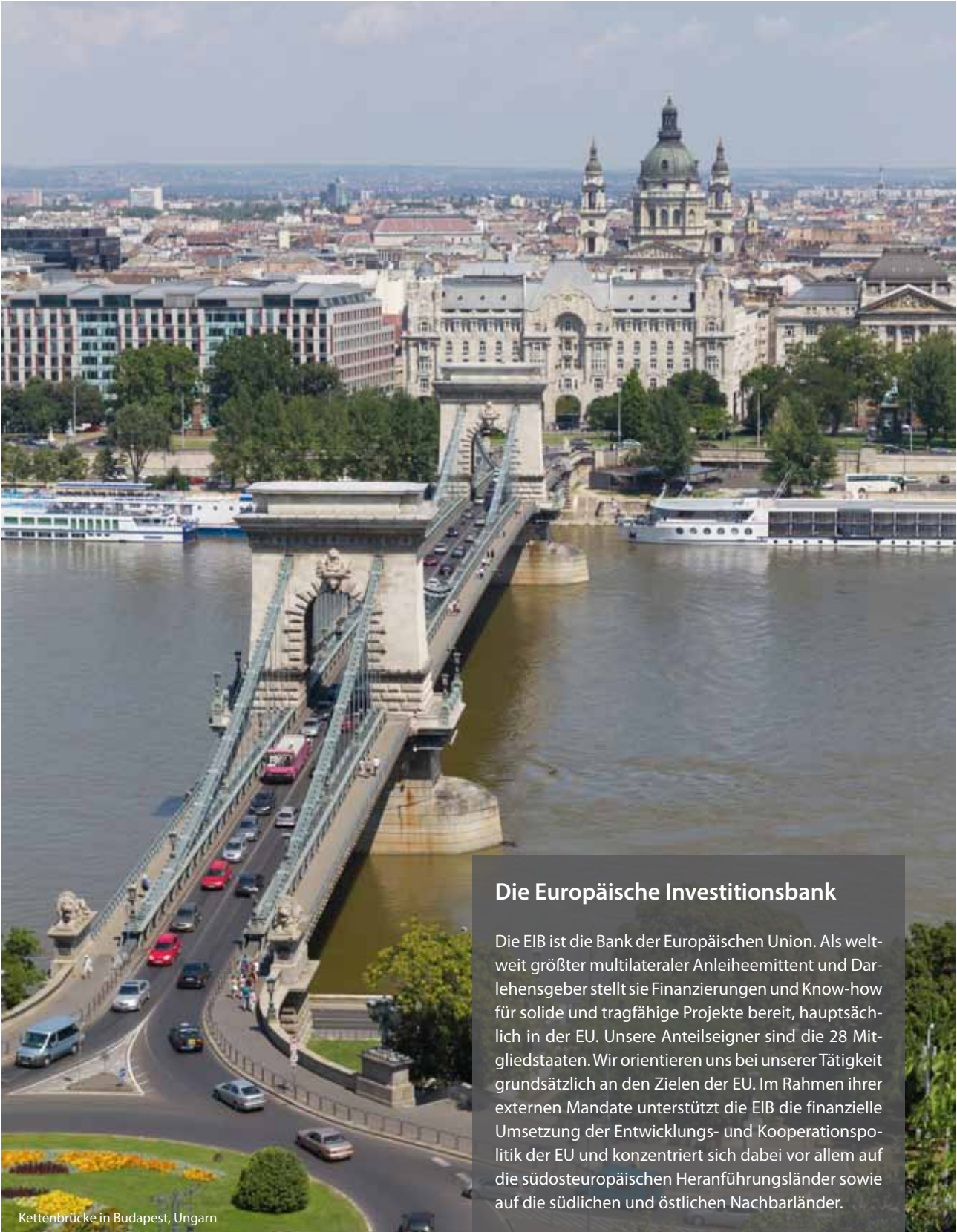
Kettenbrücke in Budapest, Ungarn