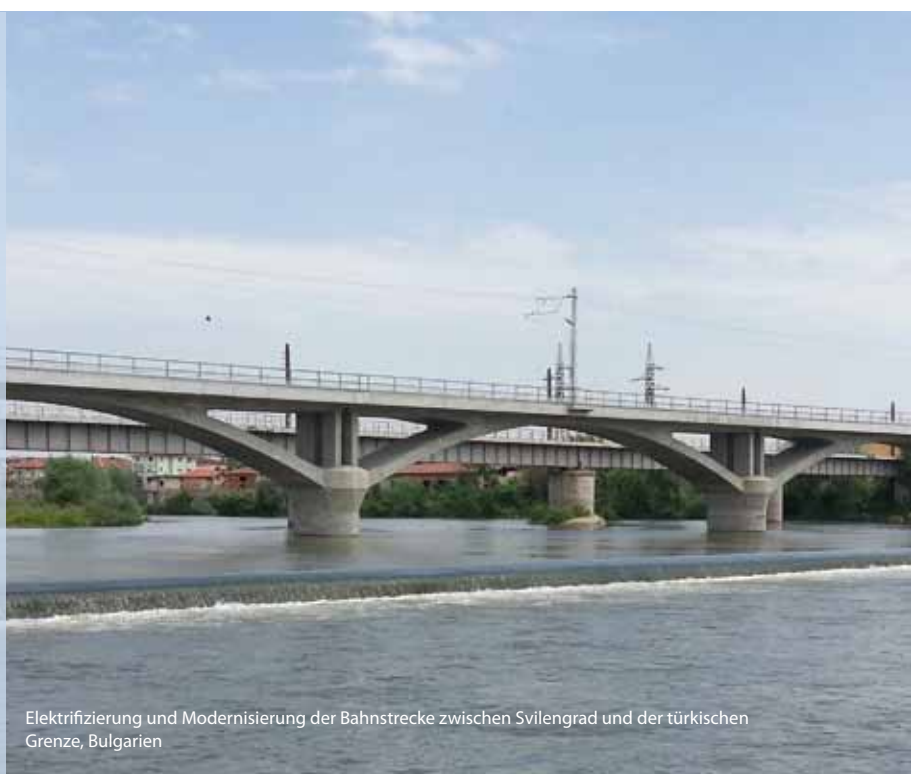
Elektrifizierung und Modernisierung der Bahnstrecke zwischen Svilengrad und der türkischen Grenze, Bulgarien