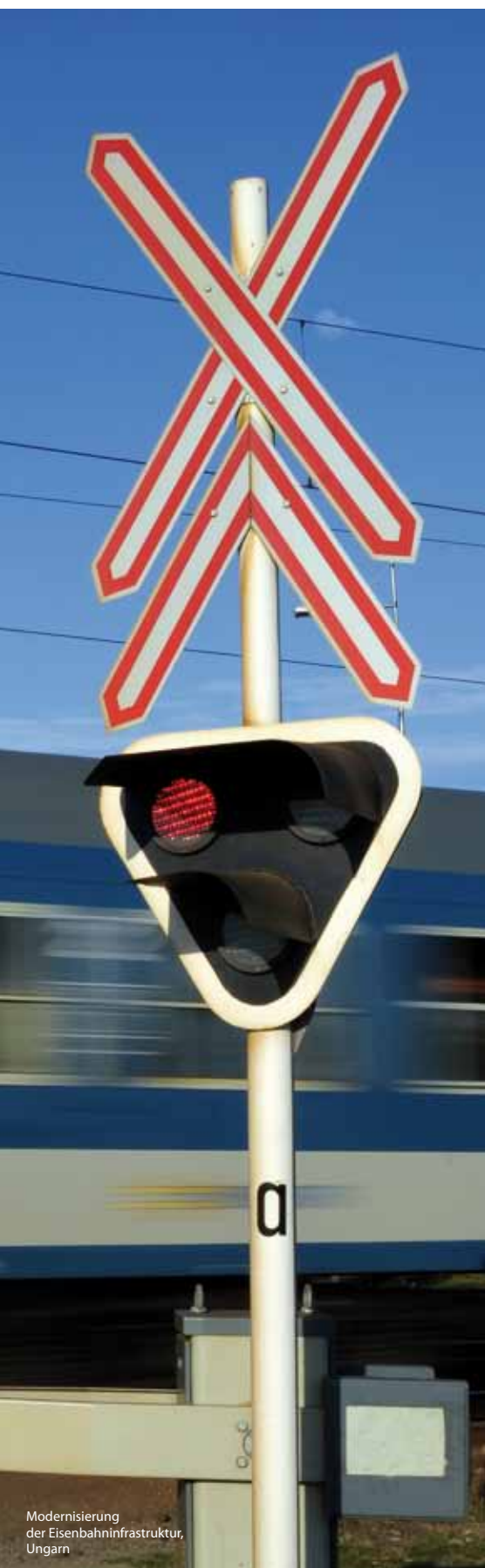
Modernisierung der Eisenbahninfrastruktur, Ungarn