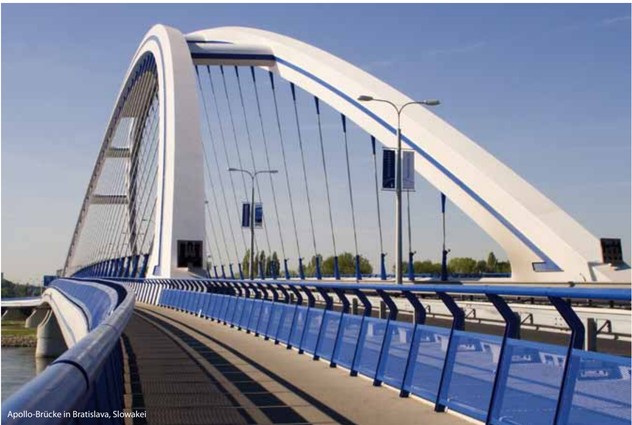
Apollo-Brücke in Bratislava, Slowakei

Im Donauraum leben mehr als 115 Millionen Menschen. Das Einzugsgebiet der Donau erstreckt sich auf neun EU-Mitgliedstaaten 1 und fünf Nicht-EU-Länder 2 . Der zur Europäischen Union gehörende Teil der Region macht ein Fünftel des Territoriums der EU aus. Die Wirtschaft, die Wettbewerbsfähigkeit und das Wohlergehen der Donauländer hängen eng mit der Entwicklung in der EU insgesamt zusammen. Deshalb hat die Europäische Union eine makroökonomische Strategie entwickelt, um die grenzüberschreitende Zusammenarbeit im Donauraum zu stärken. Die EIB unterstützt diese Strategie uneingeschränkt.