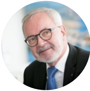
Werner Hoyer President i BEI-së