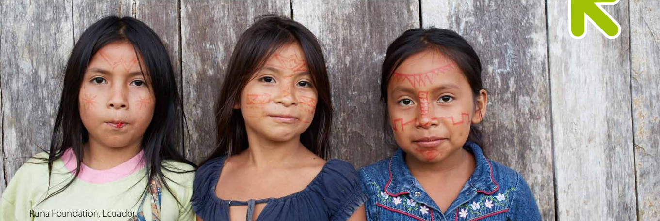
Runa Foundation, Ecuador