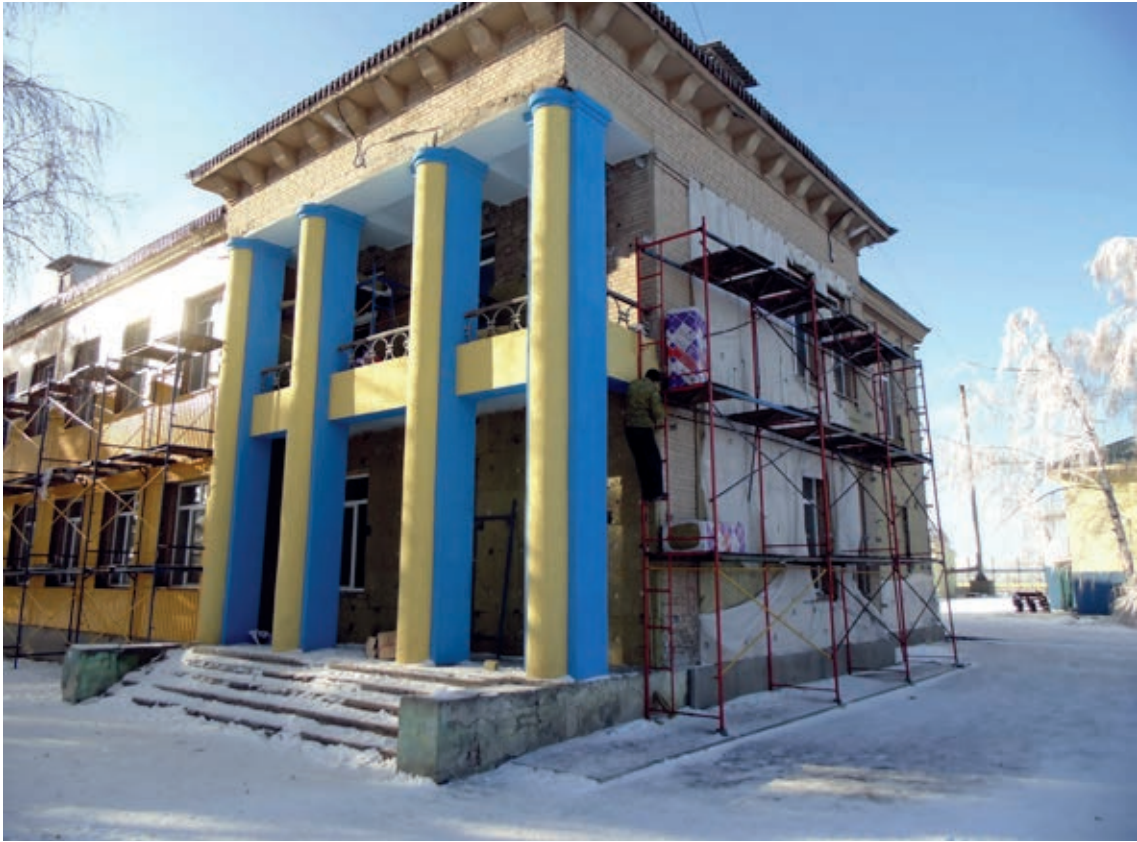
Una escuela de Volnovaja, en el sudeste de Ucrania, que estaba en proceso de renovación gracias a un préstamo del Banco Europeo de Inversiones. Abajo, ese mismo lugar, tras ser destruido durante los recientes combates en la región de Donetsk.