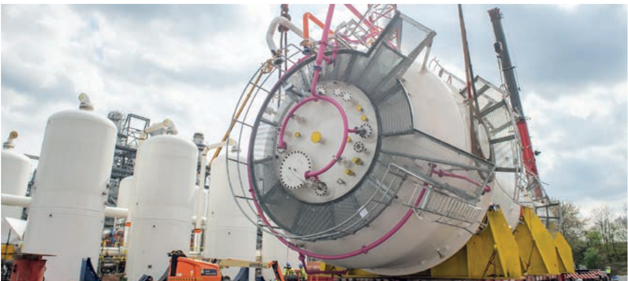
Heben von Bioreaktoren, die für die Erzeugung von CO 2 -neutralem Stahl im Stahlwerk Steelanol von ArcelorMittal Belgium in Gent eingesetzt werden.