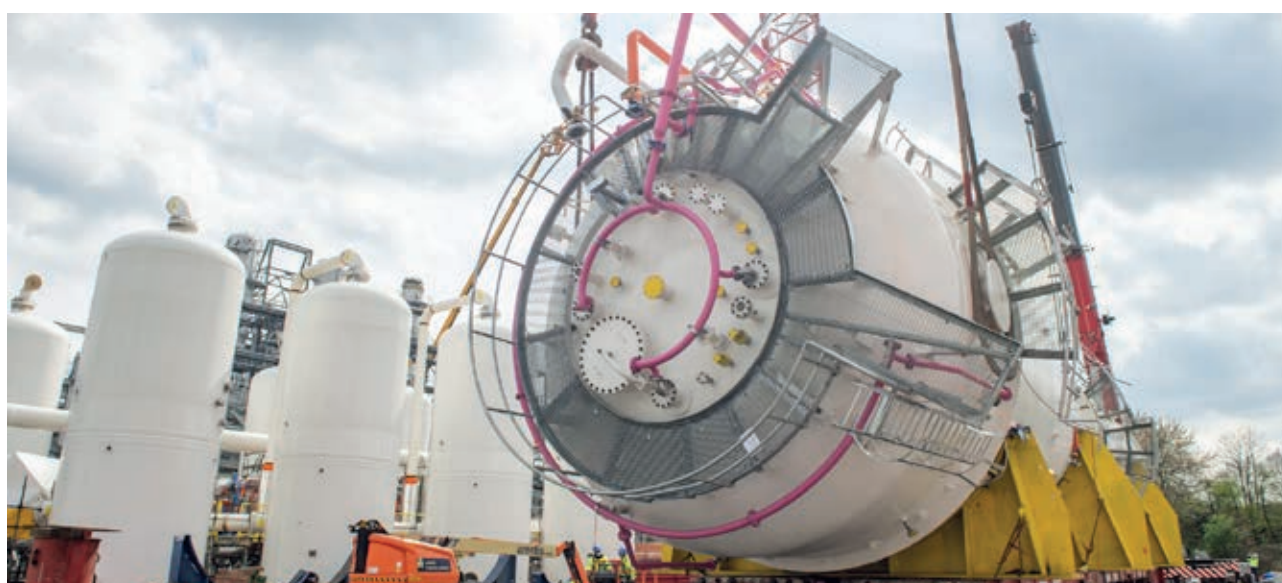
Hijsoperatie van een van de bioreactoren voor de Steelanol-installatie van ArcelorMittal Belgium te Gent, die een koolstofneutrale staalproductie mogelijk moet maken.